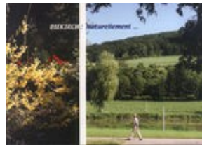
Diekirch: Naturellement ...