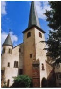
La Vieille Eglise Saint Laurent