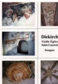
Fresques de la Vieille Eglise Saint Laurent