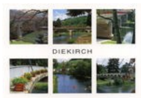
Les deux ponts