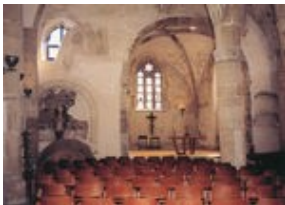
Intérieur de la Vieille Eglise Saint Laurent