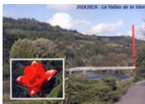
Vallée de la Sûre