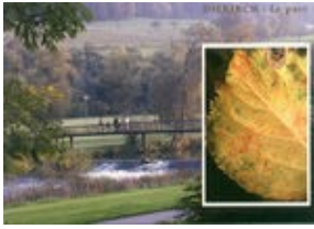
Le parc à Diekirch