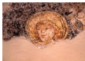
Fresque datant du 16e siècle après J.-C. représentant Saint Laurent