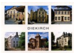
Palais de Justice, Château Wirtgen,