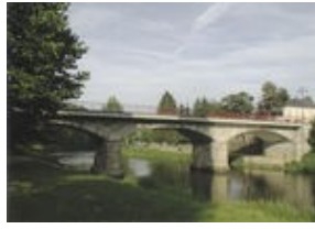
Pont de la Sûre