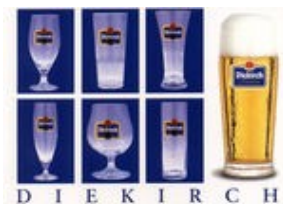
Assortiment de verres à bière de la brasserie de Diekirch