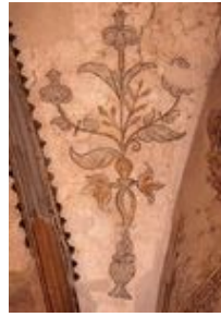
Fresque datant du 17e siècle après J.-C.