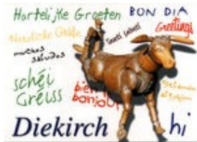
L'âne, la mascotte de Diekirch