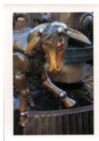
Détail de la fontaine des ânes